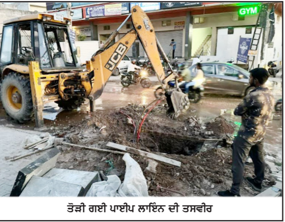
ਤੋੜੀ ਗਈ ਪਾਈਪ ਲਾਇਨ ਦੀ ਤਸਵੀਰ