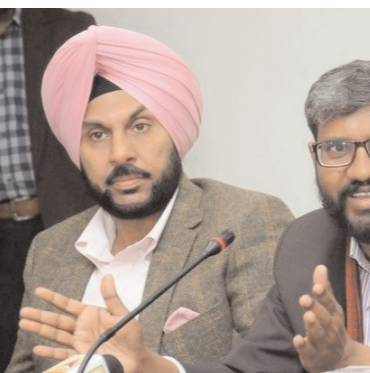
ਅਤੇ 4 ਜੂਨ ਨੂੰ ਵੋਟਾਂ ਦੀ ਗਿਣਤੀ ਸ਼ੁਰੂ ਹੋਵੇਗੀ। ਜਿਲ੍ਹਾ ਚੋਣ ਅਫਸਰ

ਵਾਪਸ ਕੀਤੀਆਂ ਜਾ ਸਕਦੀਆਂ ਹਨ। 1 ਜੂਨ ਨੂੰ ਵੋਟਾਂ ਪੈਣਗੀਆਂ ਨੇ ਦੱਸਿਆ ਕਿ ਚੋਣ ਕਮਿਸ਼ਨ ਦੀਆਂ ਹਦਾਇਤਾਂ ਅਨੁਸਾਰ ਇਸ ਵਾਰ ਚੋਣ ਲੜਨ ਵਾਲੇ ਉਮੀਦਵਾਰ 95 ਲੱਖ ਰੁਪਏ ਤੱਕ ਖਰਚ ਕਰ ਸਕਣਗੇ। ਜਨਰਲ ਵਰਗ ਲਈ ਨਾਮਜ਼ਦਗੀ ਫੀਸ 25 ਹਜ਼ਾਰ ਰੁਪਏ ਰੱਖੀ ਗਈ ਹੈ, ਜਦਕਿ ਰਿਜ਼ਰਵ ਸ਼੍ਰੇਣੀ ਲਈ ਨਾਮਜ਼ਦਗੀ ਫੀਸ 12.5 ਹਜ਼ਾਰ ਰੁਪਏ ਰੱਖੀ ਗਈ ਹੈ। ਇਸ ਵਾਰ 85 ਸਾਲ ਤੋਂ ਵੱਧ ਉਮਰ ਦੇ ਅਤੇ ਅਧਿਕ ਵਿਅਕਤੀ ਵੀ ਘਰ ਬੈਠੇ ਹੀ ਆਪਣੀ ਵੋਟ ਪਾ ਸਕਣਗੇ, ਜਿਨ੍ਹਾਂ ਦੀ ਗਿਣਤੀ ਕੁਮਵਾਰ 18348 ਅਤੇ 16946 ਹੈ, ਜਦਕਿ ਜਿਲ੍ਹੇ 'ਚ 72 ਟਰਾਂਸਜੈਂਡਰ ਵੋਟਰ ਵੀ ਹਨ। ਜਿਲ੍ਹਾ ਚੋਣ ਅਫਸਰ ਨੇ ਦੱਸਿਆ ਕਿ ਜਿਲ੍ਹੇ 'ਚ 1122 ਥਾਵਾਂ 'ਤੇ 2126 ਪੌਲਿੰਗ ਬੁਥ ਬਣਾਏ ਗਏ ਹਨ ਅਤੇ ਹਰ ਵਿਧਾਨ ਸਭਾ ਹਲਕੇ 'ਚ 10 ਆਧੁਨਿਕ ਬੁਥ ਵੀ ਬਣਾਏ ਗਏ ਹਨ, ਜਿੱਥੇ ਵੋਟਰਾਂ ਨੂੰ ਹਰ ਤਰ੍ਹਾਂ ਦੀਆਂ ਸਹੂਲਤਾਂ ਮਿਲਣਗੀਆਂ। ਉਨ੍ਹਾਂ ਕਿਹਾ ਕਿ ਚੋਣ ਜਾਬਤਾ ਲਾਗੂ ਹੋਣ ਕਾਰਨ ਹਰ ਸਰਕਾਰੀ ਚੋਣ ਪ੍ਰਚਾਰ ਸਮੱਗਰੀ ਨੂੰ ਹਟਾਉਣ ਦਾ ਕੰਮ ਸ਼ੁਰੂ ਕਰ ਦਿੱਤਾ ਗਿਆ ਹੈ ਅਤੇ ਇਸ ਨੂੰ 24 ਘੰਟਿਆਂ 'ਚ ਮੁਕੰਮਲ ਕਰ ਲਿਆ ਜਾਵੇਗਾ। ਵੱਖ-ਵੱਖ ਥਾਵਾਂ 'ਤੇ ਲਗਾਏ ਗਏ ਸਿਆਸੀ ਪਾਰਟੀਆਂ ਦੇ ਹੋਰਡਿੰਗਜ਼ ਨੂੰ ਹਟਾਉਣ ਦਾ ਕੰਮ ਵੀ ਸ਼ੁਰੂ ਕਰ ਦਿੱਤਾ ਗਿਆ ਹੈ। ਜਿਲ੍ਹਾ ਚੋਣ ਅਫਸਰ ਨੇ ਦੱਸਿਆ ਕਿ ਜਿਲ੍ਹੇ ਵਿੱਚ 99 ਵਲਾਇੰਗ ਸਕੂਲਾਂ ਤਹਿਤ 2126 ਕੀਤੇ ਗਏ ਹਨ ਅਤੇ ਜਾਂਚ ਪੜਤਾਲ ਦਾ ਕੰਮ 24 ਘੰਟੇ ਜਾਰੀ ਰਹੇਗਾ। ਇਸ ਤੋਂ ਇਲਾਵਾ ਜੇਕਰ