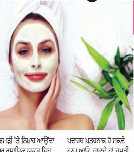
ਚਮੜੀ 'ਤੇ ਨਿਖਰ ਆਉਣ ਵਾਲੇ ਪਦਾਰਕ ਖ਼ਤਰਨਾਕ ਹੋ ਸਕਦੇ ਹਨ। ਆਓ, ਜਾਣਦੇ ਹਾਂ ਚਮੜੀ

ਚਿ ਹਰੇ ਵੀ ਰੰਗਤ ਨੂੰ ਬਹੁਤ ਸਾਰੇ ਕਾਰਕ ਪ੍ਰਭਾਵਿਤ ਕਰਦੇ ਹਨ, ਉਹ ਸੂਰਜ ਦੀ ਰੋਸ਼ਨੀ ਜਾਂ ਠੰਢੇ ਵੀ ਹੋ ਸਕਦੀ ਹੈ, ਪੂੜ ਅਤੇ ਖੁੰਘਾਂ ਵੀ ਅਤੇ ਖ਼ਾਣ-ਪੀਣ ਦੀਆਂ ਗ਼ਲਤ ਆਦਤਾਂ ਵੀ। ਤੁਸੀਂ ਇਨ੍ਹਾਂ ਕਾਰਨਾਂ ਨੂੰ ਖ਼ਤਮ ਤਾਂ ਨਹੀਂ ਕਰ ਸਕਦੇ ਪਰ ਜੇ ਚਾਹੋ ਤਾਂ ਕੁਝ ਸਪਾਰਟ ਵਸਤਾਂ ਦੀ ਵਰਤੋਂ ਕਰ ਕੇ ਆਪਣੀ ਚਮੜੀ ਨੂੰ ਸਾਫ਼ ਰੱਖ ਸਕਦੇ ਹੋ। ਕਈ ਵਾਰ ਗੈਰ ਰੰਗ ਰੁਦਰਤੀ ਹੁੰਦਾ ਹੈ ਪਰ ਇਸ ਨੂੰ ਕਾਇਮ ਰੱਖਣ ਲਈ ਵੀ ਕੁਝ ਨਾ ਕੁਝ ਕਰਨਾ ਪੈਂਦਾ ਹੈ। ਬਾਜ਼ਰ ਵਿਚ ਕਈ ਅਜਿਹੇ ਉਪਕਰਣ ਹਨ, ਜੋ ਇਹ ਆਦਾ ਕਰਦੇ ਹਨ ਕਿ ਉਨ੍ਹਾਂ ਦੀ ਵਰਤੋਂ ਨਾਲ