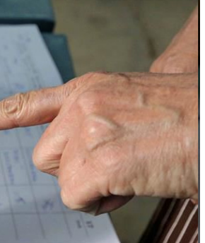
ਨਿਬੰਧ ਟਾਪੂ, ਜੰਮੂ ਅਤੇ ਕਸ਼ਮੀਰ, ਲਕਸ਼ਦੀਪ ਅਤੇ ਪੁਡੁਚੇਰੀ ਵਿੱਚ ਇਕ-ਇਕ ਸੀਟ 'ਤੇ ਪਹਿਲੇ ਪੜਾਅ ਵਿੱਚ ਵੋਟਿੰਗ ਹੋਵੇਗੀ। ਨਾਮਜ਼ਦਗੀ ਇਸ ਮਹੀਨੇ ਦੀ 27 ਤਾਰੀਖ ਤੱਕ ਭਰੇ ਜਾ ਸਕਦੇ ਹਨ। ਵੋਟਿੰਗ 19 ਅਪ੍ਰੈਲ ਨੂੰ ਹੋਵੇਗੀ। ਲੋਕ ਸਭਾ ਦੀਆਂ 543 ਸੀਟਾਂ ਲਈ ਆਮ ਚੋਣਾਂ 19 ਅਪ੍ਰੈਲ ਤੋਂ ਸ਼ੁਰੂ ਹੋ ਕੇ 7 ਗੇੜ ਵਿੱਚ ਹੋਣਗੀਆਂ। ਵੋਟਾਂ ਦੀ ਗਿਣਤੀ 4 ਜੂਨ ਨੂੰ ਹੋਵੇਗੀ।

ਨਵੀਂ ਦਿੱਲੀ, 21 ਮਾਰਚ - ਕੌਮੀ ਪੱਤ੍ਰਿਕਾ ਬਿਊਰੋ- ਚੋਣ ਕਮਿਸ਼ਨ ਨੇ ਲੋਕ ਸਭਾ ਚੋਣਾਂ ਦੇ ਪਹਿਲੇ ਗੇੜ 'ਚ 102 ਸੀਟਾਂ ਲਈ ਬੁੱਧਵਾਰ ਨੂੰ ਨੋਟੀਫਿਕੇਸ਼ਨ ਜਾਰੀ ਕੀਤੀ ਹੈ। ਪਹਿਲੇ ਗੇੜ ਵਿੱਚ 19 ਅਪ੍ਰੈਲ ਨੂੰ 17 ਸਥਾਨਾਂ ਅਤੇ 4 ਕੇਂਦਰ ਸ਼ਾਸਿਤ ਪ੍ਰਦੇਸ਼ਾਂ ਦੀਆਂ 102 ਲੋਕ ਸਭਾ ਸੀਟਾਂ ਲਈ ਵੋਟਿੰਗ ਹੋਵੇਗੀ। ਇਨ੍ਹਾਂ 'ਚ ਤਾਮਿਲਨਾਡੁ ਦੀਆਂ 33, ਰਾਜਸਥਾਨ ਦੀਆਂ 12, ਉਤਰ ਪ੍ਰਦੇਸ਼ ਦੀਆਂ 8, ਮੱਧ ਪ੍ਰਦੇਸ਼ ਦੀਆਂ 6, ਉਤਰਾਖੰਡ, ਅਸਾਮ ਅਤੇ ਮਹਾਰਾਸ਼ਟਰ ਦੀਆਂ 5-5, ਬਿਹਾਰ ਦੀਆਂ 4, ਪੰਜਾਬ ਦੀਆਂ 3, ਅਰੁਣਾਚਲ ਪ੍ਰਦੇਸ਼, ਮਨੀਪੁਰ ਅਤੇ ਮੇਘਾਲਿਆ ਦੀਆਂ 2-2 ਸੀਟਾਂ ਹਨ। ਛੱਤੀਸਗੜ੍ਹ, ਜ਼ਿਕਮ, ਨਾਗਾਲੈਂਡ, ਜ਼ਿਕਮ, ਤ੍ਰਿਪੁਰਾ, ਅਨਾਦਮਨ ਅਤੇ