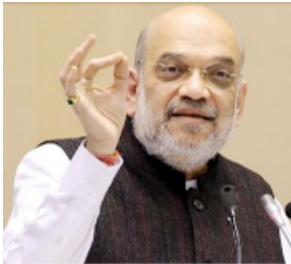
ਨਵੀਂ ਦਿੱਲੀ, 21 ਮਾਰਚ - ਕੌਮੀ ਪੱਤ੍ਰਿਕਾ ਬਿਊਰੋ- ਲੋਕ ਸਭਾ ਚੋਣਾਂ 2024 ਦੇ ਬਿਗੁਲ ਵਜੋਂ ਚੁੱਕੇ ਹੋਏ, ਜਿਸ ਨੂੰ ਲੋਕ ਸਿਆਸੀ ਪਾਰਟੀਆਂ ਪੂਰੀ ਤਰ੍ਹਾਂ ਸਰਗਰਮ ਹਨ। ਗੁਰਿ ਮੰਤਰੀ ਅਮਿਤ ਸ਼ਾਹ ਨੇ ਅਕਾਲੀ ਦਲ ਨਾਲ ਗੱਲਬਾਤ ਨੂੰ ਲੋਕ ਸਭਾ ਚੋਣਾਂ ਵਿੱਚ ਸੁਝਾਅ ਦਿੱਤਾ ਹੈ। ਉਨ੍ਹਾਂ ਕਿਹਾ ਕਿ ਸਾਡੀ ਅਕਾਲੀ ਦਲ ਨਾਲ ਗੱਲਬਾਤ ਜਾਰੀ ਹੈ ਅਤੇ 2-3 ਦਿਨਾਂ 'ਚ ਇਸ ਬਾਬਤ ਸਥਿਤੀ ਸਪੱਸ਼ਟ ਹੋ ਜਾਵੇਗੀ। ਸੀਟਾਂ ਦੀ ਵੰਡ ਨੂੰ ਲੈ ਕੇ ਜੇਕਰ ਸਥਿਤੀ ਸਾਫ਼ ਹੋ ਜਾਵੇ ਤਾਂ 2-3 ਦਿਨਾਂ ਵਿੱਚ ਗੱਲਬਾਤ ਸੰਭਵ ਹੋ ਸਕੇਗੀ। ਸ਼ਾਹ ਨੂੰ ਕਿਹਾ ਕਿ ਅਸੀਂ ਚਾਹੁੰਦੇ ਹਾਂ ਕਿ ਐੱਨ. ਡੀ. ਏ. ਦੇ ਸਾਰੇ ਸਹਿਯੋਗੀ ਇਕ ਮੱਚ 'ਤੇ ਇਕੱਠੇ ਹੋਣ। ਚੰਦੇਰੀਏ ਕਿ ਅਕਾਲੀ-ਭਾਜਪਾ ਦਾ ਗਠਜੋੜ ਕਿਸਾਨ 370 ਪਾਰ ਦਾ ਸੁਫ਼ਨਾ ਪੂਰਾ ਕਰਨਾ ਹੈ ਅੰਦੋਲਨ ਅਤੇ ਤਿੰਨ ਕਾਲੇ ਖੇਤੀ

ਹੈ। ਚੰਦੇਰੀਏ ਕਿ ਭਾਜਪਾ ਲੋਕ ਸਭਾ ਚੋਣਾਂ ਨੂੰ ਲੈ ਕੇ ਹੁਣ ਤੱਕ ਅਸੀਂ ਬਾਰ 400 ਪਾਰ ਦਾ ਨਾਅਰਾ ਦਿੰਦੇ ਰਹੇ ਹਾਂ। ਉਹ ਅਕਾਲੀ ਦਲ ਦੇ ਪ੍ਰਧਾਨ ਸੁਬਬੀਰ ਨੇ ਇਹ ਬਿਆਨ ਦਿੱਤਾ ਸੀ ਕਿ ਉਹ ਦਿੱਲੀ ਗਏ ਹੀ ਨਹੀਂ ਤਾਂ ਗਠਜੋੜ ਦਾ ਸਵਾਲ ਹੀ ਨਹੀਂ ਪਰ ਗੁਰਿ ਮੰਤਰੀ ਅਮਿਤ ਸ਼ਾਹ ਦਾ ਬਿਆਨ ਕਾਫ਼ੀ ਅਹਿਮ ਹੈ। ਚਰਾਅਲ ਸੁਬਬੀਰ ਦੇ ਇਹ ਬਿਆਨ ਦਿੱਲੀ ਦੀਆਂ ਬਹੁਗਾਂ 'ਤੇ ਡਟੇ ਕਿਸਾਨ ਅੰਦੋਲਨ 2.0 ਕਾਰਨ ਹੈ, ਕਿਉਂਕਿ ਕਿਸਾਨਾਂ ਦੀ ਮੰਗਾਂ ਨੂੰ ਲੈ ਕੇ ਅਕਾਲੀ ਦਲ ਨੇ ਗਠਜੋੜ ਤੋੜਿਆ ਸੀ। ਹੁਣ ਮੌਜੂਦਾ ਸਿਆਸੀ ਮਾਹੌਲ ਨੂੰ ਵੇਖਿਆ ਜਾਵੇ ਤਾਂ ਅਕਾਲੀ ਤੇ ਭਾਜਪਾ ਨਾਲ ਗੱਲਬਾਤ ਨਹੀਂ ਕੀਤੀ ਗਈ। ਚੰਦੇਰੀਏ ਕਿ ਅਕਾਲੀ-ਭਾਜਪਾ ਦਾ ਗਠਜੋੜ ਕਿਸਾਨ 370 ਪਾਰ ਦਾ ਸੁਫ਼ਨਾ ਪੂਰਾ ਕਰਨਾ ਹੈ ਅੰਦੋਲਨ ਅਤੇ ਤਿੰਨ ਕਾਲੇ ਖੇਤੀ