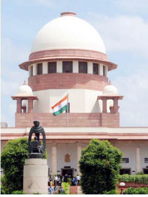
ਨਵੀਂ ਦਿੱਲੀ, 21 ਮਾਰਚ - ਕੌਮੀ ਪੱਤ੍ਰਿਕਾ ਬਿਊਰੋ- ਸੁਪਰੀਮ ਕੋਰਟ ਨੇ ਚੋਣਾਂ ਦੌਰਾਨ ਮੁਕਤ ਸੰਗੀਤਾਂ ਤੇ ਸੁਰਲਾਂਗਾਂ ਦਾ ਵਾਅਦਾ ਕਰਨ ਵਾਲੀਆਂ ਸਿਆਸੀ ਪਾਰਟੀਆਂ ਮਿਲਾਫ਼ ਜਨਹਿਤ ਪਟੀਸ਼ਨ ਵੀਰਵਾਰ ਨੂੰ ਸੁਣਵਾਈ ਲਈ ਸੂਚੀਬੱਧ ਕਰਨ ਲਈ ਸਹਿਮਤੀ ਦੇ ਦਿੱਤੀ ਹੈ। ਇਹ ਅਹਿਮ ਕਦਮ 19 ਅਪਰੈਲ ਤੋਂ ਸ਼ੁਰੂ ਹੋ ਰਹੀਆਂ ਲੋਕ ਸਭਾ ਚੋਣਾਂ ਤੋਂ ਪਹਿਲਾਂ ਚੁੱਕਿਆ ਗਿਆ ਹੈ। ਜਨਹਿਤ ਪਟੀਸ਼ਨ 'ਚ ਚੋਣ ਕਮਿਸ਼ਨ ਤੋਂ ਅਜਿਹੀਆਂ ਸਿਆਸੀ ਪਾਰਟੀਆਂ ਦੀ ਰਜਿਸਟਰੇਸ਼ਨ ਰੱਦ ਕਰਨ ਅਤੇ ਚੋਣ ਨਿਬੰਧ ਕਰਨ ਵਾਲੀਆਂ ਪਟੀਸ਼ਨਾਂ 'ਤੇ ਸ਼ਕਤੀਆਂ ਦੀ ਵਰਤੋਂ ਕਰਨ ਲਈ ਨਿਰਦੇਸ਼ ਦੇਣ ਦੀ ਮੰਗ ਕੀਤੀ ਗਈ ਹੈ। ਚੰਦੇਰੀਏ ਕਿ ਅਕਾਲੀ-ਭਾਜਪਾ ਦਾ ਗਠਜੋੜ ਕਿਸਾਨ 370 ਪਾਰ ਦਾ ਸੁਫ਼ਨਾ ਪੂਰਾ ਕਰਨਾ ਹੈ ਅੰਦੋਲਨ ਅਤੇ ਤਿੰਨ ਕਾਲੇ ਖੇਤੀ