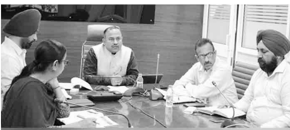
ਚੰਡੀਗੜ੍ਹ, 21 ਮਾਰਚ - ਕੌਮੀ ਪੱਤ੍ਰਿਕਾ ਵਿਖੇ

ਪੰਜਾਬ ਦੇ ਮੁੱਖ ਚੋਣ ਅਧਿਕਾਰੀ ਸਿਬਿਨ ਸੀ ਨੇ ਪੰਜਾਬ ਰਾਜ ਲਈ ਲੋਕ ਸਭਾ ਚੋਣਾਂ 2024 ਦਾ ਚੋਣ ਪ੍ਰੋਗਰਾਮ ਜਾਰੀ ਕਰ ਦਿੱਤਾ ਹੈ। ਇਸ ਸਬੰਧੀ ਅਹਿਮ ਜਾਣਕਾਰੀ ਦਿੰਦਿਆਂ ਉਨ੍ਹਾਂ ਦੱਸਿਆ ਕਿ ਚੋਣਾਂ ਲਈ ਗਣਤੰਤਰ ਨੀਤੀਵਿਧੀ 7 ਮਈ, 2024 (ਮੰਗਲਵਾਰ) ਨੂੰ ਜਾਰੀ ਕੀਤਾ ਜਾਣਾ ਤੈਅ ਹੋਇਆ ਹੈ। ਨਾਮਜ਼ਦਗੀਆਂ ਲਈ ਅੰਤਿਮ ਮਿਤੀ 14 ਮਈ, 2024 (ਮੰਗਲਵਾਰ) ਨਿਰਧਾਰਤ ਕੀਤੀ ਗਈ ਹੈ ਜਦਕਿ ਨਾਮਜ਼ਦਗੀਆਂ ਦੀ ਪਤਝਾਲ 15 ਮਈ, 2024 (ਸ਼ੁੱਕਰਵਾਰ)