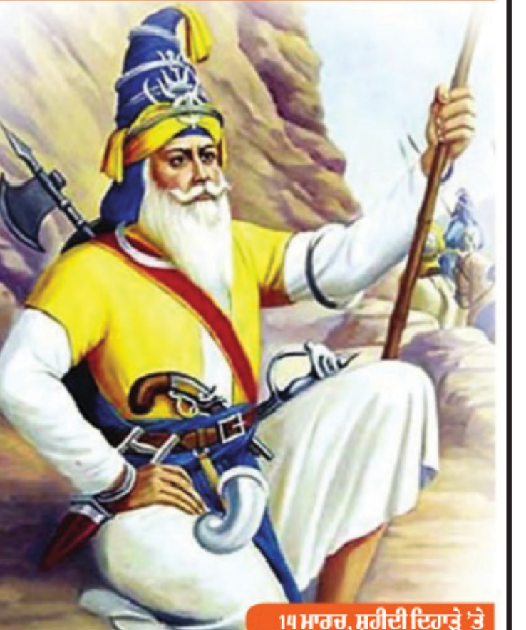
14 ਮਾਰਚ, ਸ਼ਹੀਦੀ ਦਿਹਾੜੇ 'ਤੇ