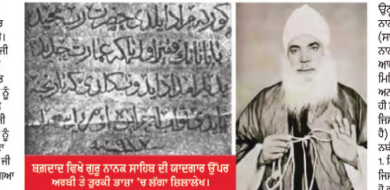
ਗੁਰੂ ਨਾਨਕ ਸਾਹਿਬ ਦੀ ਯਾਦਗਾਰ ਉਪਰ ਅਰਬੀ ਤੇ ਤੁਰਕੀ ਭਾਸ਼ਾ 'ਚ ਲੱਗਾ ਸਿਲਾਲੇਖ।

ਗੁਰੂ ਨਾਨਕ ਸਾਹਿਬ ਦੇ ਸਫ਼ਰ ਨਾਮਾ ਦਾ ਅਰਥ ਦੇਸ਼ਾਂ ਦਾ ਸਫ਼ਰਨਾਮਾ ਹੈ। ਇਸ ਵਿਚ ਗੁਰੂ ਨਾਨਕ ਸਾਹਿਬ ਦੇ ਸਫ਼ਰਾਂ ਦੀ ਵਿਸਤਾਰਦਾਰ ਵੇਰਵੇ ਦਿੱਤੀ ਗਈ ਹੈ।