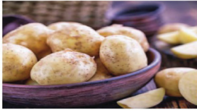
ਫਰਾਈਜ਼ ਜਾਂ ਤਲੇ ਹੋਏ ਆਲੂ ਖਾਣਾ ਪਸੰਦ ਕਰਦੇ ਹਨ। ਜੇ ਤੁਸੀਂ ਵੀ ਉਨ੍ਹਾਂ ਲੋਕਾਂ ਵਿਚ ਸ਼ਾਮਲ ਹੋ, ਜੋ ਆਲੂ ਨੂੰ ਲੰਮੇ ਸਮੇਂ ਤਕ ਸੁਰੱਖਿਅਤ ਰੱਖਣ ਲਈ ਫਰਿਜ 'ਚ ਰੱਖਦੇ ਹੋ, ਤਾਂ ਤੁਸੀਂ ਗ਼ਲਤ ਕਰ ਰਹੇ ਹੋ। ਆਲੂ ਨੂੰ ਫਰਿਜ 'ਚ ਰੱਖਣਾ ਖ਼ਤਰਨਾਕ ਹੋ ਸਕਦਾ ਹੈ।

ਜਦੋਂ ਆਲੂ ਨੂੰ ਫਰਿਜ 'ਚ ਰੱਖਿਆ ਜਾਂਦਾ ਹੈ ਤਾਂ ਫਰਿਜ ਦਾ ਠੰਡਾ ਤਾਪਮਾਨ ਆਲੂ ਦਾ ਮੌਜੂਦ ਸਟਾਰਚ ਨੂੰ ਸੁਗਰ 'ਚ ਬਦਲ ਦਿੰਦਾ ਹੈ। ਇਹ ਸੁਗਰ ਖ਼ਤਰਨਾਕ ਕੈਮੀਕਲ 'ਚ ਤਬਦੀਲ ਹੋ ਜਾਂਦੀ ਹੈ ਤੇ ਇਸ ਦਾ ਸੇਵਨ ਕਈ ਤਰ੍ਹਾਂ ਦੇ ਕੈਂਸਰ ਦਾ ਕਾਰਨ ਬਣ ਸਕਦਾ ਹੈ। ਇਸ 'ਚ ਮੌਜੂਦ ਸਟਾਰਚ ਤੇ ਕਾਰਬੋਹਾਈਡ੍ਰੇਟ ਗਠੀਏ ਦੇ ਮਹੀਜ਼ਾਂ ਲਈ ਨੁਕਸਾਨਦੇਹ ਹੈ। ਇਹ ਉਨ੍ਹਾਂ ਦੇ ਠੰਡੇ ਨੂੰ ਵਧਾ ਕੇ ਗਠੀਏ ਦਾ ਦਰਦ ਹੋਰ ਵੀ ਵਧਾ ਦਿੰਦੇ ਹਨ।