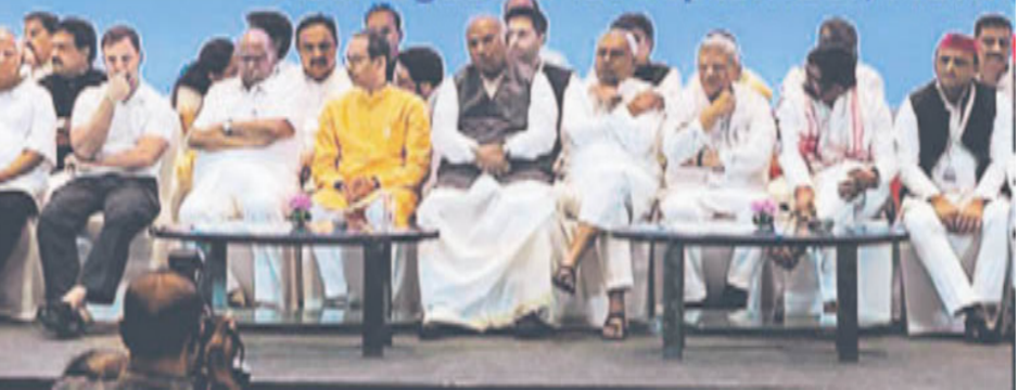
31st August to 1st September, Mumbai

ਦੂਜੇ ਪਾਸੇ ਵਿਰੋਧੀ ਧਿਰ ਜਾਂ ਫਿਰ 'ਇੰਡੀਆ' ਗੱਠਜੋੜ ਦੀ ਛਤਰੀ ਹੇਠ ਇਕੱਠੇ ਹੋਏ ਇਕ ਅਹਿਮ ਵਰਗ ਦਾ ਕੀ ਹਾਲ ਹੈ? ਕਾਂਗਰਸ ਅਤੇ ਕੁਝ ਖੇਤਰੀ ਪਾਰਟੀਆਂ ਦੀ ਨੁਮਾਇੰਦਗੀ ਕਰਨ ਵਾਲੀਆਂ ਵੱਖ-ਵੱਖ ਤਾਕਤਾਂ ਦਾ ਇਹ ਗੱਠਜੋੜ ਆਪਣੇ ਆਪ ਨੂੰ ਅਤੀਤ ਦੇ ਗੱਠਜੋੜਾਂ ਦੇ ਪ੍ਰਤੀਰੂਪ ਵਜੋਂ ਦੇਖਦਾ ਹੈ (ਭਾਵੇਂ ਇਹ ਚੋਣਾਂ ਤੋਂ ਬਾਅਦ ਦੀਆਂ