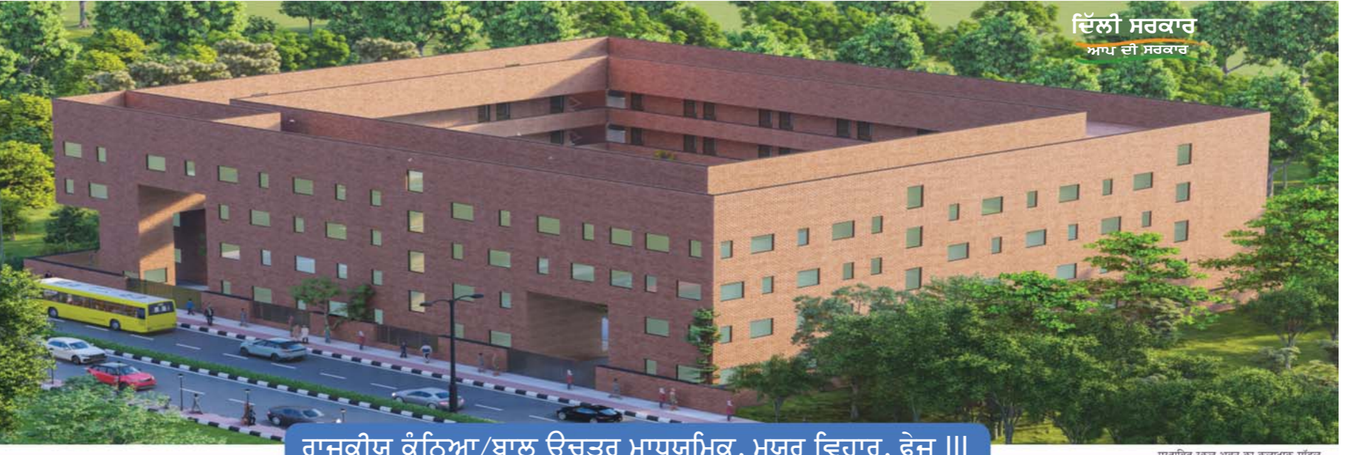
ਰਾਜਕੀਯ ਕੰਨਿਆ/ਬਾਲ ਉਚਤਰ ਮਾਧਯਮਿਕ, ਮਯੂਰ ਵਿਹਾਰ, ਫੇਜ਼ III

ਅੰਮ੍ਰਿਤਸਰ 8 ਫਰਵਰੀ। ਸ਼੍ਰੀ ਅਕਾਲ ਤਖ਼ਤ ਸਾਹਿਬ ਦੇ ਜਥੇਦਾਰ ਸਿੰਘ ਸਾਹਿਬ ਗਿਆਨੀ ਰਘਬੀਰ ਸਿੰਘ ਨੇ ਮਹਾਰਾਸ਼ਟਰ ਸਰਕਾਰ ਵੱਲੋਂ ਤਖ਼ਤ ਸੱਚਖੰਡ ਸ੍ਰੀ ਅਬਿਚਲ ਨਗਰ, ਹਜ਼ੂਰ ਸਾਹਿਬ ਨਾਂਦੇੜ ਪ੍ਰਬੰਧਕੀ ਬੋਰਡ ਦੇ ਐਕਟ ਵਿੱਚ ਮਨਮਰਜ਼ੀ ਨਾਲ ਸੋਧ ਕਰਕੇ ਸ਼੍ਰੋਮਣੀ ਗੁਰਦੁਆਰਾ ਪ੍ਰਬੰਧਕ ਕਮੇਟੀ ਵੱਲੋਂ ਨਾਮਜ਼ਦ ਮੈਂਬਰਾਂ ਦੀ ਗਿਣਤੀ ਘਟਾ ਕੇ ਸਰਕਾਰ ਵੱਲੋਂ ਨਾਮਜ਼ਦ ਮੈਂਬਰਾਂ ਦੀ ਗਿਣਤੀ ਵਧਾਉਣ ਦੀ ਕਾਰਵਾਈ ਦੀ ਕਰੜੀ ਨਿੰਦਾ ਕੀਤੀ ਹੈ। ਉਨ੍ਹਾਂ ਨੇ ਕਿਹਾ ਹੈ ਕਿ ਇਹ ਸਿੱਖਾਂ ਦੇ ਧਰਮ ਵਿੱਚ ਸਿੱਧੀ ਦਖਲ ਅੰਦਾਜ਼ੀ ਹੈ, ਜਿਸ ਨੂੰ ਕਦੇ ਵੀ ਬਰਦਾਸ਼ਤ ਨਹੀਂ ਕੀਤਾ ਜਾਵੇਗਾ। ਜਥੇਦਾਰ ਗਿਆਨੀ ਰਘਬੀਰ ਸਿੰਘ ਨੇ ਆਖਿਆ ਕਿ ਸਿੱਖ ਪੰਥ ਆਪਣੇ ਪਾਵਨ ਗੁਰੂਘਰਾਂ ਦੇ ਪ੍ਰਬੰਧਾਂ ਵਿੱਚ ਸਰਕਾਰੀ ਦਖਲ ਨੂੰ ਕਿਸੇ ਵੀ ਕੀਮਤ 'ਤੇ ਬਰਦਾਸ਼ਤ ਨਹੀਂ ਕਰ ਸਕਦਾ ਹੈ। ਉਨ੍ਹਾਂ ਸ਼੍ਰੋਮਣੀ ਕਮੇਟੀ ਨੂੰ ਆਦੇਸ਼ ਕੀਤਾ ਹੈ ਕਿ ਉਹ ਸਿੱਖਾਂ ਦੇ ਪਾਵਨ ਤਖ਼ਤ ਸੱਚਖੰਡ ਸ੍ਰੀ ਅਬਿਚਲ ਨਗਰ, ਹਜ਼ੂਰ ਸਾਹਿਬ ਪ੍ਰਬੰਧਕੀ ਬੋਰਡ ਦੇ ਐਕਟ ਵਿੱਚ ਮਨਮਰਜ਼ੀ ਨਾਲ ਤਬਦੀਲੀ ਕਰਨ ਦੇ ਮਾਮਲੇ 'ਤੇ ਮਹਾਰਾਸ਼ਟਰ ਸਰਕਾਰ ਨਾਲ ਗੱਲਬਾਤ ਕਰਕੇ ਉਸ ਤੋਂ ਸਿੱਖ ਵਿਰੋਧੀ ਫੈਸਲਾ ਜਲਦ ਵਾਪਸ ਕਰਵਾਵੇ।