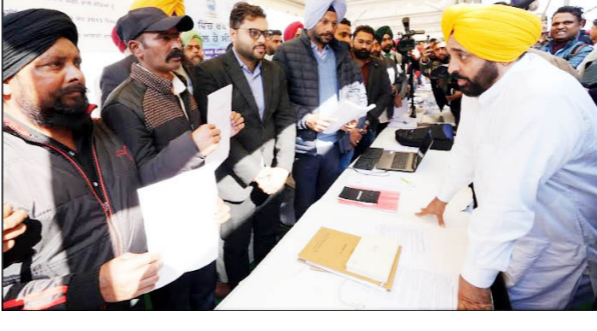
ਵਧੇਰੇ ਪਾਰਦਰਸ਼ਤਾ ਅਤੇ ਜਵਾਬਦੇਹੀ ਵਧਾਉਣ ਵਿੱਚ ਵੀ ਮਦਦ ਕਰੇਗਾ। ਭਗਵੰਤ ਸਿੰਘ ਮਾਨ ਨੇ ਕਿਹਾ ਕਿ ਸਭ ਤੋਂ ਮਹੱਤਵਪੂਰਨ ਗੱਲ ਇਹ ਹੈ ਕਿ ਇਹ ਕਦਮ ਨਾਗਰਿਕਾਂ ਨੂੰ ਸਰਕਾਰੀ ਸੇਵਾਵਾਂ ਜਾਂ ਮਸ਼ਾਲਿਆਂ ਬਾਰੇ ਆਪਣੀਆਂ ਚਿੰਤਾਵਾਂ, ਸ਼ਿਕਾਇਤਾਂ ਅਤੇ ਸੁਝਾਅ ਦੇਣ ਲਈ ਢੁਕਵਾਂ ਮੌਕ ਪ੍ਰਦਾਨ ਕਰੇਗਾ। ਮੁੱਖ ਮੰਤਰੀ ਨੇ ਕਿਹਾ ਕਿ ਪਿਛਲੀਆਂ ਸਰਕਾਰਾਂ ਨੇ ਅਜਿਹੀ ਕਿਸੇ ਵੀ ਲੋਕ-ਪੱਖੀ ਪਹਿਲਕਦਮੀ ਵੱਲ ਧਿਆਨ ਨਹੀਂ ਦਿੱਤਾ, ਜਿਸ ਕਾਰਨ ਲੋਕਾਂ ਨੂੰ ਬਹੁਤ ਜ਼ਿਆਦਾ ਪ੍ਰੇਸ਼ਾਨੀ ਦਾ ਸਾਹਮਣਾ ਕਰਨਾ ਪੈਂਦਾ ਸੀ। ਉਨ੍ਹਾਂ ਕਿਹਾ ਕਿ ਇਸ ਪਹਿਲਕਦਮੀ ਨਾਲ ਲੋਕਾਂ ਨੂੰ ਅਖਤਿਆਰ ਦੇਣ ਲਈ ਨਵੀਂ ਢਾਂਚੇ ਦੀ ਸ਼ੁਰੂਆਤ ਹੋਈ ਹੈ। ਭਗਵੰਤ ਸਿੰਘ ਮਾਨ ਨੇ ਕਿਹਾ ਕਿ ਹੁਣ ਲੋਕਾਂ ਨੂੰ ਆਪਣੇ ਕੰਮ ਕਰਵਾਉਣ ਲਈ ਸਰਕਾਰੀ ਦਫ਼ਤਰਾਂ ਦੇ ਚੱਕਰ ਨਹੀਂ ਕੱਟਣੇ ਪੈਣਗੇ, ਜਦੋਂ ਕਿ ਹੁਣ ਸਰਕਾਰ ਲੋਕਾਂ ਦੇ ਘਰਾਂ ਤੱਕ ਜਾਵੇਗੀ। ਅਕਾਲੀ ਦਲ ਦੀ 'ਪੰਜਾਬ ਬਚਾਓ ਯਾਤਰਾ' ਉੱਤੇ ਵਿਅੰਗ ਕਸਦਿਆਂ ਮੁੱਖ ਮੰਤਰੀ ਨੇ ਕਿਹਾ ਕਿ ਅਕਾਲੀ ਦਲ ਦੇ ਇਸ ਢਕਵੇਜ ਦਾ ਅਸਲ ਨਾਮ 'ਪਰਿਵਾਰ ਬਚਾਓ ਯਾਤਰਾ' ਹੈ। ਉਨ੍ਹਾਂ ਅਕਾਲੀ ਆਗੂਆਂ ਨੂੰ ਚੁਣੌਤੀ ਦਿੱਤੀ ਕਿ ਉਹ ਇਹ ਦੱਸਣ ਕਿ 15 ਸਾਲ ਸੂਬੇ ਨੂੰ ਛੱਟਣ ਮਗਰੋਂ ਹੁਣ ਕਿਸ ਤੋਂ ਸੂਬੇ ਨੂੰ ਬਚਾਉਣ ਦੀ ਕੋਸ਼ਿਸ਼ ਕਰ ਰਹੇ ਹਨ। ਉਨ੍ਹਾਂ ਕਿਹਾ ਕਿ ਅਕਾਲੀਆਂ ਨੇ ਸੂਬੇ ਨੂੰ ਬੇਰਹਿਮੀ ਨਾਲ ਲੁੱਟਿਆ ਤੇ ਸੂਬੇ ਵਿੱਚ ਕਈ ਤਰ੍ਹਾਂ ਦੇ ਮਾਫ਼ੀਆ ਦੀ ਸ਼ਕਤੀ ਪ੍ਰਾਪਤਪਾਨੀ ਕਰ ਕੇ ਪੰਜਾਬੀਆਂ ਦੀ ਮਾਨਸਿਕਤਾ ਉੱਤੇ ਭ੍ਰਿਸ਼ਮ ਜ਼ਖ਼ਮ ਦਿੱਤੇ ਹਨ। ਭਗਵੰਤ ਸਿੰਘ ਮਾਨ ਨੇ ਕਿਹਾ

ਚੰਡੀਗੜ੍ਹ (ਐਸ. ਏ. ਐਸ. ਨਗਰ), 8 ਫਰਵਰੀ - ਕੌਮੀ ਪ੍ਰਿੰਤੂਕਾ ਬਿਊਰੋ- ਪੰਜਾਬ ਵਾਸੀਆਂ ਨੂੰ ਉਨ੍ਹਾਂ ਦੇ ਬੁਝੇ ਉਤੇ ਜਾ ਕੇ ਸਰਕਾਰੀ ਸੇਵਾਵਾਂ ਮੁਹੱਈਆ ਕਰਵਾਉਣ ਲਈ ਇਕ ਹੋਰ ਨਾਗਰਿਕ ਕੇਂਦਰਿਤ ਉਪਰਾਲਾ ਕਰਦਿਆਂ ਮੁੱਖ ਮੰਤਰੀ ਭਗਵੰਤ ਸਿੰਘ ਮਾਨ ਨੇ ਅੱਜ ਸੂਬੇ ਵਿੱਚ 'ਆਪ ਦੀ ਸਰਕਾਰ, ਆਪ ਦੇ ਦੁਆਰ' ਸਕੀਮ ਦਾ ਆਗਾਜ਼ ਕੀਤਾ। ਇਸ ਸਕੀਮ ਤਹਿਤ ਲੋਕਾਂ ਨੂੰ ਸੇਵਾਵਾਂ ਦੇਣ ਲਈ ਪਿੰਡ ਤੇ ਮੁਹੱਲਾ ਪੱਧਰ ਉੱਤੇ ਕੈਂਪ ਲਾਏ ਜਾਣਗੇ। ਇੱਥੇ ਕੈਂਪ ਦੀ ਸ਼ੁਰੂਆਤ ਕਰਨ ਮੌਕੇ ਇਕੱਠੇ ਨੂੰ ਸੰਬੋਧਨ ਕਰਦਿਆਂ ਮੁੱਖ ਮੰਤਰੀ ਨੇ ਅੱਜ ਦੇ ਦਿਨ ਨੂੰ ਸੂਬੇ ਦੇ ਇਤਿਹਾਸ ਲਈ ਯਾਦਗਾਰੀ ਦਿਨ ਦੇ ਤੌਰ 'ਤੇ ਆਖਿਆ ਕਿਉਂਕਿ ਹੁਣ ਲੋਕਾਂ ਨੂੰ ਆਪਣੇ ਆਪ ਪ੍ਰਸ਼ਾਸਕੀ ਕਾਰਜਾਂ ਲਈ ਸਰਕਾਰੀ ਦਫ਼ਤਰਾਂ ਵਿੱਚ ਜਾਣਾ ਪਵੇਗਾ, ਸਗੋਂ ਸਰਕਾਰੀ ਅਧਿਕਾਰੀ ਖੁਦ ਕੇਂਦਰ ਲੋਕਾਂ ਦੇ ਸੇਵਾਵਾਂ ਮੁਹੱਈਆ ਕਰਵਾਉਣਗੇ। ਭਗਵੰਤ ਸਿੰਘ ਮਾਨ ਨੇ ਕਿਹਾ ਕਿ ਇਹ ਸਕੀਮ ਅਸਲ ਅਰਥਾਂ ਵਿੱਚ ਲੋਕਾਂ ਦੇ ਸ਼ਕਤੀਕਰਨ ਦਾ ਉਦੇਸ਼ ਪੂਰਾ ਕਰਦੀ ਹੈ, ਜਿੱਥੇ ਸਰਕਾਰ ਲੋਕਾਂ ਦੀ ਭਲਾਈ ਲਈ ਫਰਾਮਿਦਲੀ ਨਾਲ ਹੋਰ ਵੀ ਤਨਦੇਹੀ ਨਾਲ ਕੰਮ ਕਰੇਗੀ। ਮੁੱਖ ਮੰਤਰੀ ਨੇ ਉਮੀਦ ਜ਼ਾਹਰ ਕੀਤੀ ਕਿ ਇਸ ਨਾਗਰਿਕ ਕੇਂਦਰ ਉਪਰਾਲੇ ਦੀ ਸ਼ੁਰੂਆਤ ਕਰ ਕੇ ਪੰਜਾਬ ਦੇ ਇਕ ਵਾਰ ਫੇਰ ਦੇਸ਼ ਭਰ ਵਿੱਚ ਬਾਜ਼ੀ ਮਾਰ ਲਈ ਹੈ ਅਤੇ ਆਉਣ ਵਾਲੇ ਸਮੇਂ ਵਿੱਚ ਹੋਰ ਵੱਖ-ਵੱਖ ਸੂਬੇ ਵੀ ਇਸ ਸਕੀਮ ਨੂੰ ਲਾਗੂ ਕਰਨਗੇ। ਉਨ੍ਹਾਂ ਕਿਹਾ ਕਿ ਸੂਬਾ ਸਰਕਾਰ ਨੇ ਦਸੰਬਰ, 2023 ਵਿੱਚ ਲੋਕਾਂ ਨੂੰ 43