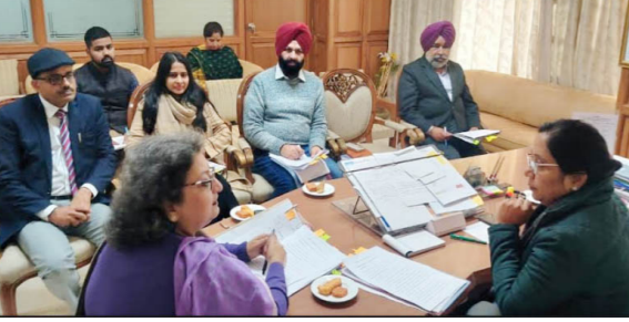
ਵਿਅਕਤੀਆਂ ਦੀ ਭਲਾਈ ਲਈ ਨੀਤੀਆਂ ਉਲੀਕਣ ਸਬੰਧੀ ਵਿਸ਼ਾਯ ਵਿੱਚ ਵਿਚਾਰ ਵਟਾਂਦਰਾ ਕੀਤਾ ਗਿਆ।