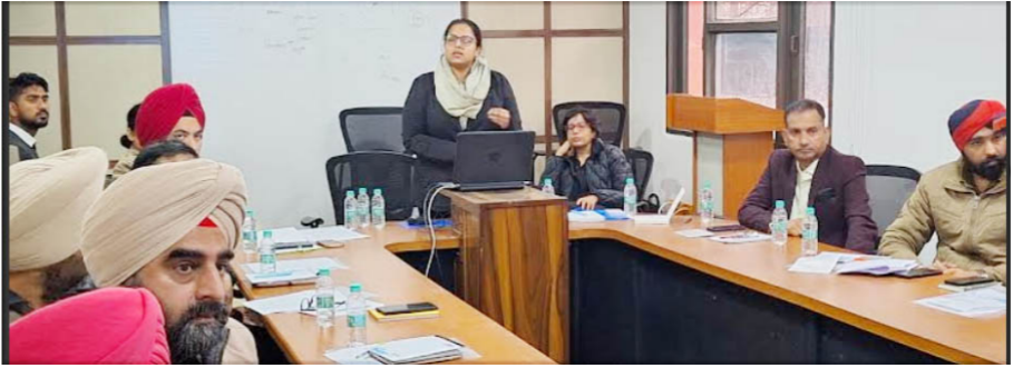
ਵਰਕਸ਼ਾਪ ਦੌਰਾਨ ਪ੍ਰਤੀਭਾਗੀਆਂ ਨੂੰ, ਸਾਈਬਰ ਕ੍ਰਾਈਮ ਅਤੇ ਸਾਈਬਰ ਇਨੋਬਲਡ ਮਨੁੱਖੀ ਤਸਕਰੀ ਨਾਲ ਨਜਿੱਠਣ ਲਈ ਲਾਅ ਇਨੋਵੇਸ਼ਨ ਏਜੰਸੀਆਂ ਦੁਆਰਾ ਵਰਤੇ ਜਾਂਦੇ ਪਲੇਟਫਾਰਮਾਂ ਅਤੇ ਐਪਲੀਕੇਸ਼ਨਾਂ ਦਾ ਪ੍ਰਦਰਸ਼ਨ ਕਰਕੇ ਜਾਗਰੂਕ ਕੀਤਾ ਗਿਆ। ਵਰਕਸ਼ਾਪ ਦੌਰਾਨ ਤਕਨਾਲੋਜੀ ਨਾਲ ਸੁਲਝਾਏ ਗਏ ਪੀੜਤਾਂ ਦੇ ਕੇਸਾਂ ਅਤੇ ਸਾਈਬਰ ਇਨੋਬਲਡ ਮਨੁੱਖੀ ਤਸਕਰੀ ਨਾਲ