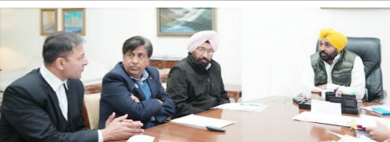
ਆਖਿਆ ਤਾਂ ਕਿ ਵਿਧਾਨ ਸਭਾ ਤੋਂ ਇਸ ਦੀ ਪ੍ਰਵਾਨਗੀ ਲਈ ਜਾ ਸਕੇ। ਮੁੱਖ ਮੰਤਰੀ ਨੇ ਕਿਹਾ ਕਿ ਗੈਰ ਕਾਨੂੰਨੀ ਕਲੋਨੀਆਂ ਬਣਾਉਣ ਨੂੰ ਰੋਕਣ ਲਈ ਗੈਰ ਕਾਨੂੰਨੀ ਕਲੋਨੀਆਂ ਵਿਰੁੱਧ ਸਖ਼ਤ ਕਾਰਵਾਈ ਕੀਤੀ ਜਾਵੇਗੀ। ਉਨ੍ਹਾਂ ਕਿਹਾ ਕਿ ਸੂਬਾ ਸਰਕਾਰ ਪੰਜਾਬ ਵਿੱਚ ਗੈਰ ਕਾਨੂੰਨੀ ਕਲੋਨੀਆਂ ਬਣਾਉਣ ਦੀ ਇਜਾਜ਼ਤ ਨਹੀਂ ਦੇਵੇਗੀ ਅਤੇ ਇਸ ਜੁਰਮ ਵਿੱਚ ਸ਼ਾਮਲ ਸਾਰੇ ਵਿਅਕਤੀਆਂ ਖ਼ਿਲਾਫ਼ ਸਖ਼ਤ ਤੋਂ ਸਖ਼ਤ ਕਦਮ ਚੁੱਕੇ ਜਾਣਗੇ। ਭਗਵੰਤ ਸਿੰਘ ਮਾਨ ਨੇ ਕਿਹਾ ਕਿ ਗੈਰ ਕਾਨੂੰਨੀ ਕਲੋਨੀਆਂ ਵਿਰੁੱਧ ਸਖ਼ਤ ਕਾਰਵਾਈ ਕੀਤੀ ਜਾਵੇਗੀ, ਜੋ ਪੰਜਾਬ ਵਿੱਚ ਕਿਸੇ ਵੀ ਤਰ੍ਹਾਂ ਗੈਰ ਕਾਨੂੰਨੀ ਕਲੋਨੀਆਂ ਬਣਨ ਤੋਂ ਰੋਕਣ ਦਾ ਕੰਮ ਕਰੇਗਾ।

ਚੰਡੀਗੜ੍ਹ, 8 ਫਰਵਰੀ - ਕੌਮੀ ਪੱਤਰਕਾਰ ਬਿਊਰੋ - ਪੰਜਾਬ ਦੇ ਮੁੱਖ ਮੰਤਰੀ ਭਗਵੰਤ ਸਿੰਘ ਮਾਨ ਨੇ ਸੂਬੇ ਵਿੱਚ ਭਵਿੱਖ ਵਿੱਚ ਗੈਰ ਕਾਨੂੰਨੀ ਕਲੋਨੀਆਂ ਬਣਨ ਤੋਂ ਰੋਕਣ ਲਈ ਗੈਰ ਕਾਨੂੰਨੀ ਕਲੋਨੀਆਂ ਵਿਰੁੱਧ ਸਖ਼ਤ ਕਾਰਵਾਈ ਵਾਸਤੇ ਅਧਿਕਾਰੀਆਂ ਨੂੰ ਬਿੱਲ ਦਾ ਖਰੜਾ ਤਿਆਰ ਕਰਨ ਲਈ ਆਖਿਆ। ਜ਼ਮੀਨ/ਜਾਇਦਾਦ ਦੀ ਰਜਿਸਟਰੇਸ਼ਨ ਲਈ ਐਨ.ਓ.ਸੀ. ਦੀ ਸ਼ਰਤ ਮੁਤਾਬਕ ਕਰਨ ਦੇ ਸੂਬਾ ਸਰਕਾਰ ਦੇ ਹਾਲੀਆ ਫੈਸਲੇ ਦੇ ਸੰਦਰਭ ਵਿੱਚ ਅੱਜ ਮੰਤਰੀ ਨੇ ਕਿਹਾ ਕਿ ਇਸ ਫੈਸਲੇ ਦਾ ਮੁੱਖ ਮੰਤਰੀ ਨੇ ਗੈਰ ਕਾਨੂੰਨੀ ਕਲੋਨੀਆਂ ਬਣਾਉਣ ਦਾ ਦਾਅਵਾ ਕੀਤਾ ਹੈ। ਉਨ੍ਹਾਂ ਕਿਹਾ ਕਿ ਗੈਰ ਕਾਨੂੰਨੀ ਕਲੋਨੀਆਂ ਦੁਆਰਾ ਸ਼ਿਕੰਜਾ ਕਸਣ ਲਈ ਨਵੇਂ ਕਾਨੂੰਨ ਬਣਾਉਣ ਦੀ ਬੇਹੱਦ ਲੋੜ ਹੈ। ਭਗਵੰਤ ਸਿੰਘ ਮਾਨ ਨੇ ਅਧਿਕਾਰੀਆਂ ਨੂੰ ਪੰਜਾਬ ਵਿਧਾਨ ਸਭਾ ਦੇ ਅਗਲੇ ਸੈਸ਼ਨ ਤੋਂ ਪਹਿਲਾਂ ਨਵੇਂ ਬਿੱਲ ਦਾ ਖਰੜਾ ਤਿਆਰ ਕਰਨ ਲਈ