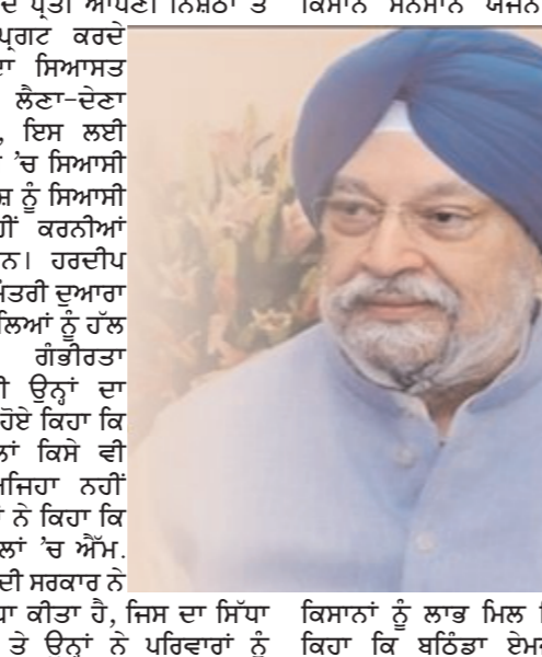
ਕਿਸਾਨਾਂ ਨੂੰ ਲਾਭ ਮਿਲ ਰਿਹਾ ਹੈ। ਉਨ੍ਹਾਂ ਨੇ ਕਿਹਾ ਕਿ ਬਠਿੰਡਾ ਏਮਜ ਦੇ ਉਦਘਾਟਨ

ਮੈਡੀਕਲ ਖੇਤਰ ਨਾਲ ਜੁੜੇ ਲੋਕ ਸਹੁੰ ਚੁੱਕ ਕੇ ਮਨੁੱਖੀ ਜੀਵਨ ਦੇ ਪ੍ਰਤੀ ਆਪਣੀ ਨਿਸ਼ਾਨਾ ਤੇ