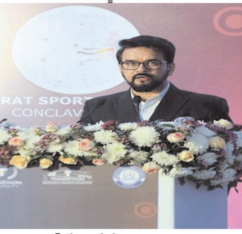
'ਗਰੀਬੀ ਹਟਾਓ' ਦੇ ਨਾਅਰੇ ਦੇ ਬਾਵਜੂਦ ਗਰੀਬ ਹੋਰ ਵੀ ਗਰੀਬ ਹੋਏ ਜਾ ਰਹੇ ਸਨ। ਉਨ੍ਹਾਂ ਕਿਹਾ, "ਜਦੋਂ ਭਾਜਪਾ ਨੇ ਨਰਿੰਦਰ ਮੋਦੀ ਨੂੰ ਵਿਕਲਪ ਵਜੋਂ ਪੇਸ਼ ਕੀਤਾ ਤਾਂ ਕਾਂਗਰਸ