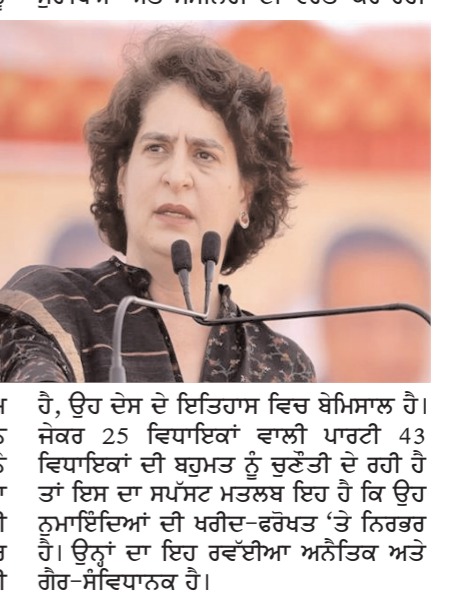
ਉਹ ਦੇਸ਼ ਦੇ ਇਤਿਹਾਸ ਵਿਚ ਬਿਮਿਸਾਲ ਹੈ। ਜੇਕਰ 25 ਵਿਧਾਇਕਾਂ ਵਾਲੀ ਪਾਰਟੀ 43 ਵਿਧਾਇਕਾਂ ਦੀ ਬਹੁਮਤ ਨੂੰ ਚੁਣੌਤੀ ਦੇ ਰਹੀ ਹੈ ਤਾਂ ਇਸ ਦਾ ਸਪੱਸ਼ਟ ਮਤਲਬ ਇਹ ਹੈ ਕਿ ਉਹ ਨੁਮਾਇੰਦਿਆਂ ਦੀ ਖਰੀਦ-ਫਰੋਖਤ 'ਤੇ ਨਿਰਭਰ ਹੈ। ਉਨ੍ਹਾਂ ਦਾ ਇਹ ਵੱਡੀਆਂ ਅਨੈਤਿਕ ਅਤੇ ਗੈਰ-ਸੰਵਿਧਾਨਕ ਹੈ।

ਸੱਤਾ ਦੀ ਦੁਰਵਰਤੋਂ ਕਰ ਕੇ ਹਿਮਾਚਲ ਵਾਸੀਆਂ ਦੇ ਇਸ ਅਧਿਕਾਰ ਨੂੰ ਕੁਚਲਣਾ ਚਾਹੁੰਦੀ ਹੈ। ਜਿਸ ਤਰ੍ਹਾਂ ਭਾਜਪਾ ਇਸ ਮਕਸਦ ਲਈ ਸਰਕਾਰੀ ਸੁਰੱਖਿਆ ਅਤੇ ਮਸ਼ੀਨਰੀ ਦੀ ਵਰਤੋਂ ਕਰ ਰਹੀ ਹੈ, ਉਹ ਦੇਸ਼ ਦੇ ਇਤਿਹਾਸ ਵਿਚ ਬਿਮਿਸਾਲ ਹੈ। ਜੇਕਰ 25 ਵਿਧਾਇਕਾਂ ਵਾਲੀ ਪਾਰਟੀ 43 ਵਿਧਾਇਕਾਂ ਦੀ ਬਹੁਮਤ ਨੂੰ ਚੁਣੌਤੀ ਦੇ ਰਹੀ ਹੈ ਤਾਂ ਇਸ ਦਾ ਸਪੱਸ਼ਟ ਮਤਲਬ ਇਹ ਹੈ ਕਿ ਉਹ ਨੁਮਾਇੰਦਿਆਂ ਦੀ ਖਰੀਦ-ਫਰੋਖਤ 'ਤੇ ਨਿਰਭਰ ਹੈ। ਉਨ੍ਹਾਂ ਦਾ ਇਹ ਵੱਡੀਆਂ ਅਨੈਤਿਕ ਅਤੇ ਗੈਰ-ਸੰਵਿਧਾਨਕ ਹੈ।