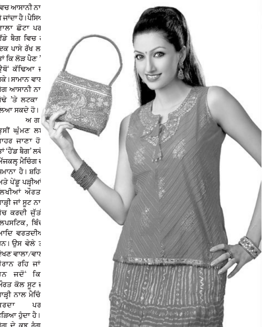
ਜ਼ਰੂਰੀ ਹੈ। ਜਿਸਦਾ ਉਮਰ ਵਾਲੀਆਂ ਔਰਤਾਂ ਭੜਕੀਲੇ ਰੰਗ ਦੇ ਪਰਸ ਨਾ ਖਰੀਦਣ। ਅਗਰ ਤੁਸੀਂ ਦਵਤਰ ਵਿਚ ਕੰਮ ਕਰਦੇ ਹੋ ਤਾਂ ਤੁਹਾਡੇ ਕੋਲ ਹਲਕਾ ਰੰਗ ਹੀ ਜਚੇਗਾ। ਭੜਕੀਲੇ ਰੰਗ ਤਾਂ ਚੜ੍ਹਦੀ ਜਵਾਨੀ 'ਤੇ ਹੀ ਵਧਦੇ ਹਨ। -ਭੋਲਾ ਨੂਰਪੁਰਾ,

ਪਰਸ ਠੀਕ ਰਹੇਗਾ। ਪਰਸ ਦੀ ਖਰੀਦ ਸਮੇਂ ਆਪਣੀ ਉਮਰ ਦਾ ਖਿਆਲ ਰੱਖਣਾ ਚਾਹੀਦਾ ਹੈ। ਚਾਰ ਵਾਰ ਲਗਾ ਕੇ ਦੇਖ ਲਵੋ ਕਿ ਲਾਉਣ/ਖਿਲਣ ਵੇਲੇ ਫਸਦੀ ਤਾਂ ਨਹੀਂ? ਪਰਸ ਦੀਆਂ ਵੱਦਰੀਆਂ (ਪੱਟੀਆਂ) ਆਪਣੀ ਉਮਰ ਦਾ ਖਿਆਲ ਰੱਖਣਾ ਚਾਹੀਦਾ ਹੈ। ਪਰਸ ਠੀਕ ਰਹੇਗਾ। ਪਰਸ ਦੀ ਖਰੀਦ ਸਮੇਂ ਆਪਣੀ ਉਮਰ ਦਾ ਖਿਆਲ ਰੱਖਣਾ ਚਾਹੀਦਾ ਹੈ। ਚੰਗੀ ਤਰ੍ਹਾਂ ਪਰਖ ਲਵੋ ਕਿ ਉਹ ਮਜ਼ਬੂਤ ਵੀ ਹਨ, ਕਿਉਂਕਿ ਪਰਸ ਵੱਦਰੀਆਂ ਸਹਾਰੇ ਹੀ ਤੁਹਾਡੇ ਮੌਜੂਦਾ 'ਤੇ ਲਟਕਦਾ ਹੈ। ਬਾਜ਼ਾਰ ਵਿਚ ਚਮੜੇ, ਕੋਮ ਅਤੇ ਰੈਕਸਨ ਦੇ ਪਰਸ ਮੌਜੂਦ ਹੁੰਦੇ ਹਨ। ਵਿਆਹ ਜਾਂ ਪਾਰਟੀ 'ਤੇ ਜਾਣ ਲਈ ਵੈਸੀ ਪਰਸ ਠੀਕ ਰਹਿੰਦਾ ਹੈ ਜਦ ਕਿ ਕੰਮਕਾਜ ਵਾਲੀਆਂ ਲਈ ਚਮੜੇ ਦਾ