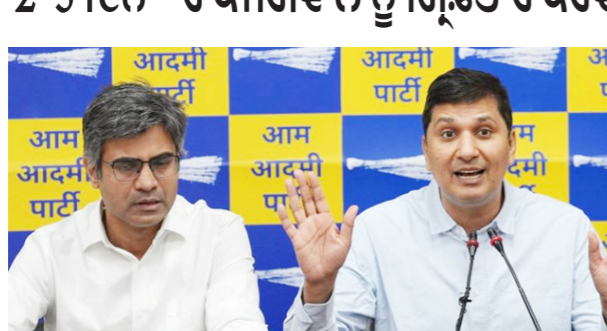
ਨਵੀਂ ਦਿੱਲੀ, 24 ਫਰਵਰੀ - ਕੌਮੀ ਪੱਤ੍ਰਿਕਾ ਬਿਊਰੋ- 'ਆਪ' ਨੇ ਅੱਜ ਦੱਸ ਲਾਇਆ ਕਿ ਭਾਜਪਾ ਦੀ ਅਗਵਾਈ ਵਾਲੀ ਕੇਂਦਰ ਲੋਕ ਸਭਾ ਚੋਣਾਂ ਲਈ ਕਾਂਗਰਸ ਨਾਲ ਪਾਰਟੀ ਦੇ ਗਠਜੋੜ ਤੋਂ ਡਰੀ ਹੋਈ ਹੈ ਅਤੇ ਇੱਕੋ ਹੀ ਦਿਨ ਵਿਚਾਲੇ ਕੇਜਰੀਵਾਲ ਨੂੰ ਗ੍ਰਿਫ਼ਤਾਰ ਕਰਨ ਲਈ ਸੀਬੀਆਈ ਦੀ ਵਰਤੋਂ ਕਰ ਰਹੀ ਹੈ। ਇਸ ਦੌਰ 'ਤੇ ਕੇਂਦਰੀ ਜਾਂਚ ਬਿਊਰੋ