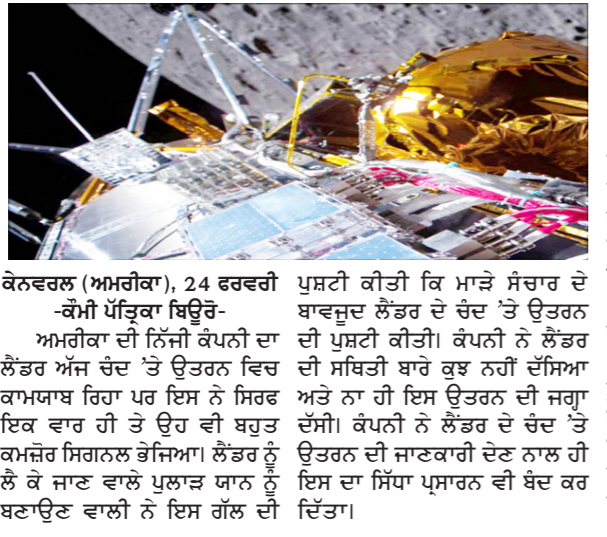
ਕੋਨਕਰਲ (ਅਮਰੀਕਾ), 24 ਫਰਵਰੀ - ਕੌਮੀ ਪੱਤ੍ਰਿਕਾ ਬਿਊਰੋ- ਅਮਰੀਕਾ ਦੀ ਨਿੱਜੀ ਕੰਪਨੀ ਦਾ ਲੈਂਡਰ ਅੰਸ਼ ਚੰਦ 'ਤੇ ਉਤਰਨ ਵਿਚ ਕਮਯਾਬ ਰਿਹਾ ਪਰ ਇਸ ਨੇ ਸਿਰਫ਼ ਇਕ ਵਾਰ ਹੀ ਤੇ ਉਹ ਵੀ ਬਹੁਤ ਕਮਜ਼ੋਰ ਸਿਗਨਲ ਭੇਜਿਆ। ਲੈਂਡਰ ਨੂੰ ਲੋਕ ਜਾਣ ਵਾਲੇ ਪੁਲਾੜ ਯਾਨ ਨੂੰ ਬਣਾਉਣ ਵਾਲੀ ਨੇ ਇਸ ਗੱਲ ਦੀ