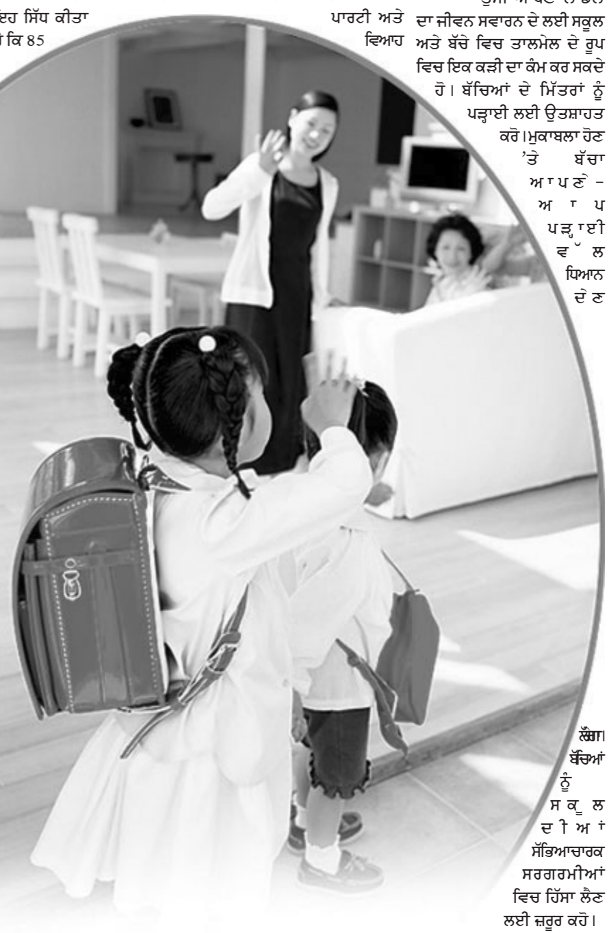
ਲੱਗਾ ਬੱਚਿਆਂ ਨੂੰ ਸਕੂਲ ਦੇ ਮਿੱਤਰਾਂ ਸੱਭਿਆਚਾਰਕ ਸਰਗਰਮੀਆਂ ਵਿਚ ਹਿੱਸਾ ਲੈਣ ਲਈ ਜ਼ਰੂਰ ਕਰੋ।

ਤੁਸੀਂ ਆਪਣੇ ਲਾਡਲੇ ਦਾ ਜੀਵਨ ਸਵਾਰਨ ਦੇ ਲਈ ਸਕੂਲ ਅਤੇ ਬੱਚੇ ਵਿਚ ਤਾਲਮੇਲ ਦੇ ਰੂਪ ਵਿਚ ਇਕ ਕੜੀ ਦਾ ਕੰਮ ਕਰ ਸਕਦੇ ਹੋ। ਬੱਚਿਆਂ ਦੇ ਮਿੱਤਰਾਂ ਨੂੰ ਪੜ੍ਹਾਈ ਲਈ ਉਤਸ਼ਾਹਿਤ ਕਰੋ। ਮੁਕਾਬਲਾ ਹੋਣ 'ਤੇ ਬੱਚਾ ਆਪਣੇ-ਆਪ ਪੜ੍ਹਾਈ ਵੱਲ ਧਿਆਨ ਦੇਣ