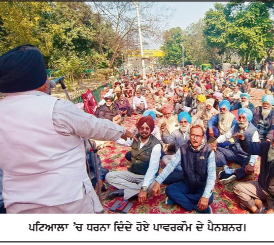
ਪਟਿਆਲਾ 'ਚ ਧਰਨਾ ਦਿੰਦੇ ਹੋਏ ਪਾਵਰਕੌਮ ਦੇ ਪੈਨਸ਼ਨਰ।