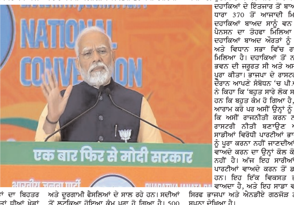
ਏਕ ਬਾਰ ਫਿਟ ਸੇ ਸੋਦੀ ਸਰਕਾਰ

ਦੇ ਹਨ। ਪ੍ਰਧਾਨ ਮੰਤਰੀ ਨਰਿੰਦਰ ਮੋਦੀ ਨੇ ਕਿਹਾ ਕਿ ਅੱਜ ਵਿੱਚ ਕਮਾਲ ਕਰਨਗੀਆਂ। ਪਿਛਲੇ 10 ਸਾਲ ਦੌਰਾਨ ਸਾਲਾਂ ਦੀ ਉਡੀਕ ਤੋਂ ਬਾਅਦ ਬਣਿਆ ਰਾਮ ਮੰਦਰ ਸੱਤ ਦਹਾਕਿਆਂ ਦੇ ਇਤਿਹਾਸ ਤੋਂ ਬਾਅਦ ਦੇਸ਼ ਨੂੰ ਧਾਰਾ 370 ਤੋਂ ਆਜ਼ਾਦੀ ਮਿਲੀ। ਚਾਰ ਦਹਾਕਿਆਂ ਬਾਅਦ ਸਾਨੂੰ ਵਨ ਰੋਕ ਵਨ ਪੋਨਸਨ ਦਾ ਤਹੱਸ ਮਿਲਿਆ ਹੈ। ਤਿੰਨ ਦਹਾਕਿਆਂ ਬਾਅਦ ਔਰਤਾਂ ਨੂੰ ਲੋਕ ਸਭਾ ਅਤੇ ਵਿਧਾਨ ਸਭਾ ਵਿੱਚ ਰਾਖਵਾਂਕਰਨ ਮਿਲਿਆ ਹੈ। ਦਹਾਕਿਆਂ ਤੋਂ ਨਵੀਂ ਸੰਸਦ ਭਵਨ ਦੀ ਜ਼ਰੂਰਤ ਸੀ ਅਤੇ ਅਸੀਂ ਇਸ ਨੂੰ ਪੂਰਾ ਕੀਤਾ। ਭਾਜਪਾ ਦੇ ਰਾਸ਼ਟਰੀ ਸੰਮੇਲਨ ਦੌਰਾਨ ਆਪਣੇ ਸੰਬੋਧਨ 'ਚ ਪੀ.ਐੱਮ. ਮੋਦੀ ਨੇ ਕਿਹਾ ਕਿ 'ਬਹੁਤ ਸਾਰੇ ਲੋਕ ਸਾਨੂੰ ਕਹਿੰਦੇ ਹਨ ਕਿ ਬਹੁਤ ਕੰਮ ਹੋ ਗਿਆ ਹੈ, ਹੁਣ ਬੜਾ ਆਰਾਮ ਕਰੋ ਪਰ ਅਸੀਂ ਉਨ੍ਹਾਂ ਨੂੰ ਕਹਿੰਦੇ ਹਾਂ ਕਿ ਅਸੀਂ ਰਾਜਨੀਤੀ ਕਰਨ ਨਹੀਂ, ਸਗੋਂ ਰਾਸ਼ਟਰੀ ਨੀਤੀ ਬਣਾਉਣ ਆਏ ਹਾਂ। ਸਾਡੀਆਂ ਵਿਰੋਧੀ ਪਾਰਟੀਆਂ ਭਾਵੇਂ ਸਕੀਮਾਂ ਨੂੰ ਪੂਰਾ ਕਰਨ ਨਹੀਂ ਜਾਣਦੀਆਂ, ਪਰ ਬੁਨਿਆਦੀ ਕੰਮ ਦਾ ਉਨ੍ਹਾਂ ਕੋਲ ਕੋਈ ਜਵਾਬ ਨਹੀਂ ਹੈ। ਅੱਜ ਇਸ ਸਾਰੀਆਂ ਸਿਆਸੀ ਪਾਰਟੀਆਂ ਵਾਅਦੇ ਕਰਨ ਤੋਂ ਡਰ ਰਹੀਆਂ ਹਨ। ਇਹ ਇੱਕ ਵਿਕਾਸ ਭਾਰਤ ਦਾ ਵਾਅਦਾ ਹੈ, ਅਤੇ ਇਹ ਸਾਡਾ ਵਾਅਦਾ ਹੈ।