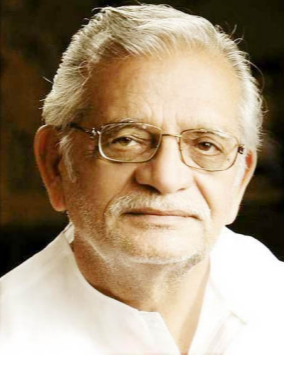
ਨਵੀਂ ਦਿੱਲੀ, 18 ਫਰਵਰੀ - ਕੌਮੀ ਪੱਤ੍ਰਿਕਾ ਵਿਭਾਗ ਪ੍ਰਸਿੱਧ ਉਰਦੂ ਕਵੀ ਗੁਲਜ਼ਾਰ ਅਤੇ ਸੰਸਕ੍ਰਿਤ ਵਿਦਵਾਨ ਜਗਦਗੁਰੂ

ਰਾਮਭਦਰਚਾਰੀਆ ਨੂੰ 2023 ਦੇ 58ਵੇਂ ਗਿਆਨਪੀਠ ਪੁਰਸਕਾਰ ਲਈ ਚੁਣਿਆ ਗਿਆ ਹੈ। ਗੁਲਜ਼ਾਰ ਨੂੰ ਹਿੰਦੀ ਸਿਨੇਮਾ ਵਿੱਚ ਆਪਣੀਆਂ ਰਚਨਾਵਾਂ ਲਈ ਜਾਣਿਆ ਜਾਂਦਾ ਹੈ ਅਤੇ ਇਸ ਯੁੱਗ ਦੇ ਉੱਤਮ ਉਰਦੂ ਕਵੀਆਂ ਵਿੱਚੋਂ ਇੱਕ ਮੰਨਿਆ ਜਾਂਦਾ ਹੈ। ਉਨ੍ਹਾਂ ਨੂੰ ਪਹਿਲਾਂ 2002 ਵਿੱਚ ਉਰਦੂ ਲਈ ਸਾਹਿਤ ਅਕਾਦਮੀ ਅਵਾਰਡ, 2013 ਵਿੱਚ ਦਾਦਾ ਸਾਹਿਬ ਫਾਲਕੇ ਅਵਾਰਡ, 2004 ਵਿੱਚ ਪਦਮ ਭੂਸ਼ਣ ਮਿਲ ਚੁੱਕਿਆ ਹੈ। ਇਸ ਤੋਂ ਇਲਾਵਾ ਪੰਜ ਰਾਸ਼ਟਰੀ ਵਿਲਮ ਪੁਰਸਕਾਰ ਮਿਲ ਚੁੱਕੇ ਹਨ। ਰਾਮਭਦਰਚਾਰੀਆ, ਚਿਤਰਕੁਟ ਵਿੱਚ ਤੁਲਸੀ ਪੀਠ ਦੇ ਸੰਸਥਾਪਕ ਅਤੇ ਮੁਖੀ ਹਨ। ਉਹ ਪ੍ਰਸਿੱਧ ਹਿੰਦੂ ਅਧਿਆਤਮਿਕ ਆਗੂ, ਸਿੱਖਿਅਕ ਅਤੇ 100 ਤੋਂ ਵੱਧ ਕਿਤਾਬਾਂ ਦੇ ਲੇਖਕ ਹਨ।