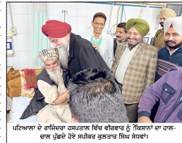
ਪਟਿਆਲਾ ਦੇ ਰਾਜਿੰਦਰਾ ਹਸਪਤਾਲ ਵਿੱਚ ਵੀਰਵਾਰ ਨੂੰ ਕਿਸਾਨਾਂ ਦਾ ਹਾਲ-ਚਾਲ ਪੁੱਛਦੇ ਹੋਏ ਸਪੀਕਰ ਕੁਲਤਾਰ ਸਿੰਘ ਸੰਧਵਾਂ।

ਪਟਿਆਲਾ, 18 ਦਵਰੀ -ਕੌਮੀ ਪੱਤ੍ਰਕਾ ਬਿਊਰੋ- ਪੰਜਾਬ ਵਿਧਾਨ ਸਭਾ ਦੇ ਸਪੀਕਰ ਕੁਲਤਾਰ ਸਿੰਘ ਸੰਧਵਾਂ ਨੇ ਅੱਜ ਪੰਜਾਬ-ਹਰਿਆਣਾ ਦੀ ਹੱਦ 'ਤੇ ਹਰਿਆਣਾ ਪੁਲੀਸ ਦੇ ਤਲੱਚ ਦਾ ਸ਼ਿਕਾਰ ਹੋਏ ਕਿਸਾਨਾਂ ਦਾ ਰਾਜਿੰਦਰਾ ਹਸਪਤਾਲ ਵਿੱਚ ਹਾਲ-ਚਾਲ ਪੁੱਛਿਆ। ਉਨ੍ਹਾਂ ਆਖਿਆ ਕਿ ਭਾਜਪਾ ਸਰਕਾਰ ਨੂੰ ਕਿਸਾਨਾਂ 'ਤੇ ਕੀਤੇ ਸਬਰ ਦਾ ਖਮਿਆਜ਼ਾ ਭੁਗਤਣਾ ਪਵੇਗਾ। ਸੀ ਸੰਧਵਾਂ ਨੇ ਕਿਸਾਨਾਂ ਦੀਆਂ ਮੰਗਾਂ ਨੂੰ ਵਾਜਬ ਦੱਸਦਿਆਂ ਕਿਹਾ ਕਿ ਸ਼ਾਂਤਮਈ ਪ੍ਰਦਰਸ਼ਨ ਕਰਨ ਦੇ ਬਾਵਜੂਦ ਹਰਿਆਣਾ ਪੁਲੀਸ ਵੱਲੋਂ ਕਿਸਾਨਾਂ 'ਤੇ ਸਬਰ ਢਾਹਿਆ ਗਿਆ ਹੈ। ਉਨ੍ਹਾਂ ਕਿਹਾ ਕਿ ਪੰਜਾਬ ਸਰਕਾਰ ਕਿਸਾਨਾਂ ਦੇ ਨਾਲ ਹੋ ਅਤੇ ਮੁੱਖ ਮੰਤਰੀ ਭਗਵੰਤ ਮਾਨ ਦੀਆਂ ਸਭ ਤੋਂ ਵੱਡੀਆਂ 'ਤੇ ਪਟਿਆਲਾ ਸਭ ਤੋਂ ਹੋਰ ਸਰਕਾਰੀ ਹਸਪਤਾਲਾਂ ਵਿੱਚ ਜ਼ਖਮੀ ਕਿਸਾਨਾਂ ਦਾ ਮੁਫ਼ਤ ਇਲਾਜ ਕੀਤਾ ਜਾ ਰਿਹਾ ਹੈ। ਮਰਹੂਮ ਰਾਮ ਮਨੋਹਰ ਲੌਹੀਆ ਦੇ ਸ਼ਬਦਾਂ 'ਜੇਕਰ ਸਰਕਾਰ ਸ਼ਾਂਤ ਹੋਈਆਂ, ਤਾਂ ਸੰਸਦ ਬੋਕਾਬੂ ਹੋ ਜਾਵੇਗੀ' ਦੇ ਹਵਾਲੇ ਨਾਲ ਸੀ ਸੰਧਵਾਂ ਨੇ ਕਿਹਾ ਕਿ ਦੇਸ਼ ਦੇ ਸਭ ਤੋਂ ਵੱਧ ਰੁਜ਼ਗਾਰ ਮੁਹੱਈਆ ਕਰਵਾਉਣ ਵਾਲੇ ਖੇਤੀ ਸੈਕਟਰ ਦੀ 65 ਫੀਸਦੀ ਕਿਸਾਨੀ ਨੂੰ ਅਣਦੇਖਿਆ ਕਰਕੇ ਕੁਝ ਕੁ ਪੂੰਜੀਪਤੀ ਘਰਾਣਿਆਂ ਦੇ ਇਸ਼ਾਰਿਆਂ 'ਤੇ ਚੱਲ ਕੇ ਹੋਰ ਸਰਕਾਰ ਪਹਿਲਾਂ ਮੰਨੀਆਂ ਮੰਗਾਂ ਤੋਂ ਵੀ ਮੁੱਕ ਰਹੀ ਹੈ। ਇਸ ਮੌਕੇ