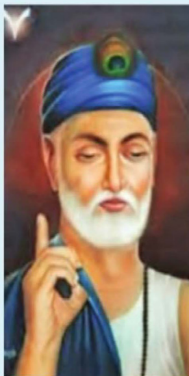
ਹਾਡ ਜਲੇ ਲੱਕੜੀ ਜਲੇ, ਜਲੇ ਜਲਾਵਨਹਾਰ ਤਮਾਸ਼ਬੀਨ ਤੀ ਨਾ ਬਰੇ, ਕਿਸਕੇ ਕਰੁ ਪੁਕਾਰ।

ਅਸੀਂ ਸਾਰੇ ਜਾਣਦੇ ਹਾਂ ਕਿ ਮਨ ਨ ਤੋਂ ਬਾਅਦ ਮਨੁੱਖੀ ਸਰੀਰ ਨੂੰ ਸਾੜ ਦਿੱਤਾ ਦਿੱਤਾ ਜਾਂਦਾ ਹੈ। ਸਿੱਤ ਕਬੀਰ ਕਹਿੰਦੇ ਹਨ ਕਿ ਹੱਡੀਆਂ ਤਾਂ ਸੜ ਜਾਂਦੀਆਂ ਹਨ, ਇਨ੍ਹਾਂ ਨੂੰ ਸਾੜਨ ਵਾਲੀ ਲੱਕੜੀ ਵੀ ਸੜ ਜਾਂਦੀ ਹੈ। ਇਨ੍ਹਾਂ ਦੋਹਾਂ ਨੂੰ ਸਾੜਨ ਵਾਲਾ ਵਿਅਕਤੀ ਵੀ ਕਿਸੇ ਦਿਨ ਸੜ ਜਾਂਦਾ ਹੈ। ਦਾਹ-ਸੰਸਕਾਰ ਵਿਚ ਸ਼ਾਮਲ ਹੋਣ ਵਾਲੇ ਵਿਅਕਤੀ ਵੀ ਆਪਣੇ ਆਪਣੇ ਸਮੇਂ ਅੱਗ ਦੀ ਭੇਟਾ ਹੋ ਜਾਂਦੇ ਹਨ। ਜਦ ਇਥੇ ਕੋਈ ਵੀ ਨਹੀਂ ਬਚਦਾ, ਤਾਂ ਕਿਸ ਦੇ ਸਾਹਮਣੇ ਪੁਕਾਰ ਕਰਾਂ।