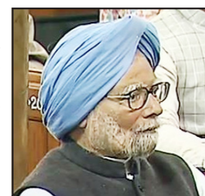
ਮੁੱਖ ਮੰਤਰੀ ਨਰਿੰਦਰ ਮੋਦੀ ਨੇ ਮੁੱਖ ਮੰਤਰੀ ਕੇਜਰੀਵਾਲ ਦੇ ਖਿਲਾਫ ਉਤਾਰ ਰਹੀ ਹੈ, ਜਿਵੇਂ ਕਿ ਮੈਂ ਸਭ ਤੋਂ ਵੱਡਾ ਅੱਤਵਾਦੀ ਹੋਵਾਂ।

ਨਵੀਂ ਦਿੱਲੀ, 9 ਫਰਵਰੀ - ਕੇਜਰੀਵਾਲ ਨੇ ਵੀਰਵਾਰ ਸ਼ਨੀਵਾਰ ਨੂੰ ਮੁੱਖ ਮੰਤਰੀ ਕੇਜਰੀਵਾਲ ਦੇ ਖਿਲਾਫ ਉਤਾਰ ਰਹੀ ਹੈ, ਜਿਵੇਂ ਕਿ ਮੈਂ ਸਭ ਤੋਂ ਵੱਡਾ ਅੱਤਵਾਦੀ ਹੋਵਾਂ। ਮੇਰੇ ਖਿਲਾਫ ਉਤਾਰ ਰਹੀ ਹੈ, ਜਿਵੇਂ ਕਿ ਮੈਂ ਸਭ ਤੋਂ ਵੱਡਾ ਅੱਤਵਾਦੀ ਹੋਵਾਂ।