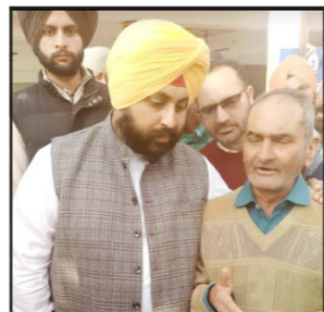
ਆਮ ਆਦਮੀ ਪਾਰਟੀ ਦੀ ਸਰਕਾਰ ਘਰ-ਘਰ ਜਾ ਕੇ ਲੋਕਾਂ ਨੂੰ ਸਰਕਾਰੀ ਸਕੀਮਾਂ ਦਾ ਲਾਭ ਯਕੀਨੀ ਬਣਾਏਗੀ, ਜਿਸ ਦੀ ਸ਼ੁਰੂਆਤ ਕੈਂਪ ਲਗਾ ਕੇ ਕੀਤੀ ਹੈ ਜਿਵੇਂ ਵੱਖ-ਵੱਖ ਵਿਭਾਗਾਂ ਦੇ ਅਧਿਕਾਰੀਆਂ/ਕਰਮਚਾਰੀਆਂ ਵੱਲੋਂ ਰਾਜ਼ਰ ਨਾਗਰਿਕਾਂ ਨੂੰ ਸੁਵਿਧਾਵਾਂ ਦਿੱਤੀਆਂ ਹਨ। ਉਨ੍ਹਾਂ ਕਿਹਾ ਕਿ ਮੁੱਖ ਮੰਤਰੀ ਸ. ਭਗਵੰਤ ਸਿੰਘ ਮਾਨ ਦੀ ਉੱਚੀ ਸੋਚ ਸਰਕਾਰ ਹੀ ਅਧਿਕਾਰੀ ਹੈ।

ਨਗਲ, 9 ਫਰਵਰੀ - ਕੇਜਰੀਵਾਲ ਨੇ ਵੀਰਵਾਰ ਸ਼ਨੀਵਾਰ ਨੂੰ ਮੁੱਖ ਮੰਤਰੀ ਕੇਜਰੀਵਾਲ ਦੇ ਖਿਲਾਫ ਉਤਾਰ ਰਹੀ ਹੈ, ਜਿਵੇਂ ਕਿ ਮੈਂ ਸਭ ਤੋਂ ਵੱਡਾ ਅੱਤਵਾਦੀ ਹੋਵਾਂ। ਮੇਰੇ ਖਿਲਾਫ ਉਤਾਰ ਰਹੀ ਹੈ, ਜਿਵੇਂ ਕਿ ਮੈਂ ਸਭ ਤੋਂ ਵੱਡਾ ਅੱਤਵਾਦੀ ਹੋਵਾਂ।