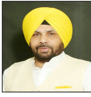
ਗੋਇੰਦਵਾਲ ਸਾਹਿਬ ਵਿਖੇ ਗੁਰੂ ਅਮਰਦਾਸ ਥਰਮਲ ਪਲਾਂਟ ਦਾ ਉਦਘਾਟਨ ਕਰਨ ਵਾਲੇ ਮੁੱਖ ਮੰਤਰੀ ਕੇਜਰੀਵਾਲ ਦੇ ਖਿਲਾਫ ਉਤਾਰ ਰਹੀ ਹੈ, ਜਿਵੇਂ ਕਿ ਮੈਂ ਸਭ ਤੋਂ ਵੱਡਾ ਅੱਤਵਾਦੀ ਹੋਵਾਂ।

ਚੰਡੀਗੜ੍ਹ, 9 ਫਰਵਰੀ - ਕੇਜਰੀਵਾਲ ਨੇ ਵੀਰਵਾਰ ਸ਼ਨੀਵਾਰ ਨੂੰ ਮੁੱਖ ਮੰਤਰੀ ਕੇਜਰੀਵਾਲ ਦੇ ਖਿਲਾਫ ਉਤਾਰ ਰਹੀ ਹੈ, ਜਿਵੇਂ ਕਿ ਮੈਂ ਸਭ ਤੋਂ ਵੱਡਾ ਅੱਤਵਾਦੀ ਹੋਵਾਂ। ਮੇਰੇ ਖਿਲਾਫ ਉਤਾਰ ਰਹੀ ਹੈ, ਜਿਵੇਂ ਕਿ ਮੈਂ ਸਭ ਤੋਂ ਵੱਡਾ ਅੱਤਵਾਦੀ ਹੋਵਾਂ।