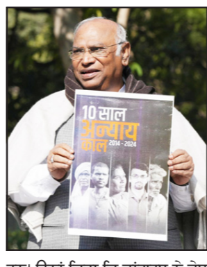
ਕਾਂਗਰਸ ਪਾਰਟੀ ਨੇ ਮੁੱਖ ਮੰਤਰੀ ਕੇਜਰੀਵਾਲ ਦੇ ਖਿਲਾਫ ਉਤਾਰ ਰਹੀ ਹੈ, ਜਿਵੇਂ ਕਿ ਮੈਂ ਸਭ ਤੋਂ ਵੱਡਾ ਅੱਤਵਾਦੀ ਹੋਵਾਂ।

ਨਵੀਂ ਦਿੱਲੀ, 9 ਫਰਵਰੀ - ਕੇਜਰੀਵਾਲ ਨੇ ਵੀਰਵਾਰ ਸ਼ਨੀਵਾਰ ਨੂੰ ਕਾਂਗਰਸ ਪਾਰਟੀ ਨੂੰ ਮੁੱਖ ਮੰਤਰੀ ਕੇਜਰੀਵਾਲ ਦੇ ਖਿਲਾਫ ਉਤਾਰ ਰਹੀ ਹੈ, ਜਿਵੇਂ ਕਿ ਮੈਂ ਸਭ ਤੋਂ ਵੱਡਾ ਅੱਤਵਾਦੀ ਹੋਵਾਂ। ਮੇਰੇ ਖਿਲਾਫ ਉਤਾਰ ਰਹੀ ਹੈ, ਜਿਵੇਂ ਕਿ ਮੈਂ ਸਭ ਤੋਂ ਵੱਡਾ ਅੱਤਵਾਦੀ ਹੋਵਾਂ।