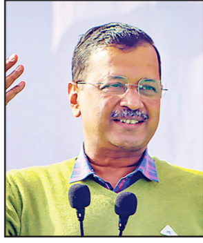
ਅਰੁਣ ਜ਼ੈਲੀ, 9 ਫਰਵਰੀ - ਕੇਜਰੀਵਾਲ ਨੂੰ ਮੁੱਖ ਮੰਤਰੀ ਕੇਜਰੀਵਾਲ ਦੇ ਖਿਲਾਫ ਉਤਾਰ ਰਹੀ ਹੈ, ਜਿਵੇਂ ਕਿ ਮੈਂ ਸਭ ਤੋਂ ਵੱਡਾ ਅੱਤਵਾਦੀ ਹੋਵਾਂ।

ਨਵੀਂ ਦਿੱਲੀ, 9 ਫਰਵਰੀ - ਕੇਜਰੀਵਾਲ ਨੇ ਵੀਰਵਾਰ ਸ਼ਨੀਵਾਰ ਨੂੰ ਕੇਂਦਰ ਸਰਕਾਰ 'ਤੇ ਦੋਸ਼ ਲਾਇਆ ਕਿ ਉਹ ਸਾਰੀਆਂ ਏਜੰਸੀਆਂ ਨੂੰ ਮੇਰੇ ਖਿਲਾਫ ਉਤਾਰ ਰਹੀ ਹੈ, ਜਿਵੇਂ ਕਿ ਮੈਂ ਸਭ ਤੋਂ ਵੱਡਾ ਅੱਤਵਾਦੀ ਹੋਵਾਂ। ਮੇਰੇ ਖਿਲਾਫ ਉਤਾਰ ਰਹੀ ਹੈ, ਜਿਵੇਂ ਕਿ ਮੈਂ ਸਭ ਤੋਂ ਵੱਡਾ ਅੱਤਵਾਦੀ ਹੋਵਾਂ। ਮੇਰੇ ਖਿਲਾਫ ਉਤਾਰ ਰਹੀ ਹੈ, ਜਿਵੇਂ ਕਿ ਮੈਂ ਸਭ ਤੋਂ ਵੱਡਾ ਅੱਤਵਾਦੀ ਹੋਵਾਂ।